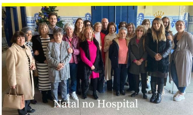
Natal no Hospital